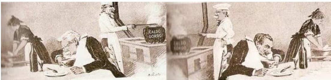
Pucherazo tanto del partido conservador -CANOVAS como del partido liberal SAGASTA

personas muertas, o impidiendo votar a las vivas, manipulación de actas, compra de votos, amenazas, coacciones... El caciquismo era ejercido por esa oligarquía, individuos o familias que por su poder económico o por sus influencias políticas controlaban una circunscripción electoral o los ayuntamientos, hacían informes y certificados personales, controlaban el sorteo de las quintas, proporcionaban trabajos, repartían las contribuciones, ejercían actividades discriminatorias y con sus "favores" agradecían su voto y el respeto de sus intereses. Esto sucedía sobre todo en el medio rural. El sufragio censitario y la abstención de buena parte de la población ayudaron al mantenimiento del sistema que quería mantener apartados a republicanos, carlistas, socialistas y nacionalistas.