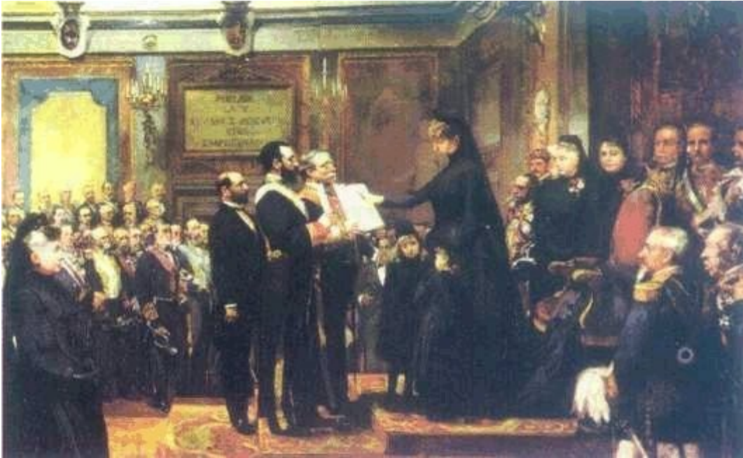
La regente M a Cristina de Habsburgo-Lorena jura la constitución de 1876 ante las Cortes, estando embarazada del futuro rey Alfonso XIII, de la mano de las Infantas Mercedes y M a Teresa.

Tras el Pacto del Pardo accedió al poder Sagasta, iniciando una serie de reformas que liberalizaron un tanto el perfil conservador del sistema, pero contando con el apoyo tácito de Cánovas: